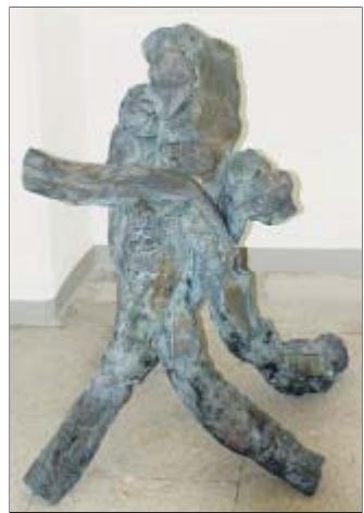
Tübenfiguren: Brodwolfs Bayreuther Vierergruppe.